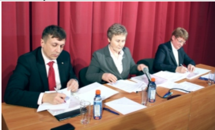
Стороны социального партнерства подписывают коллективный договор на 2013 год.

Правила внутреннего трудового распорядка будут изданы самостоятельной брошюрой.