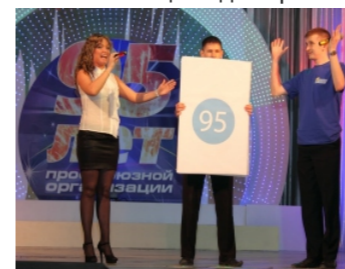
Выступление молодых профактивистов на торжестве, посвященном 95-летию организации.

В июне ко Дню рационализатора и изобретателя молодежная комиссия принимала активное участие в выставке технического творчества, а также вела подготовку к празднованию Дня металлурга.