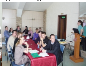
Встреча с молодежью БАЗа.